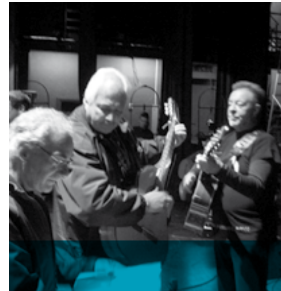
//////////////////// EL OCTETO Jueves 7 | 21:00 | Explanada de la Universidad -18 de Julio 1824, esquina Eduardo Acevedo-.

Con la convicción de que la música es no sólo una actividad de disfrute, sino una poderosa arma de educación, integración y desarrollo de nuestras capacidades, “Grupos Sonantes” se proyecta hacia un enfoque humanístico que privilegia la descentralización e integración social para todos los jóvenes de nuestro país.