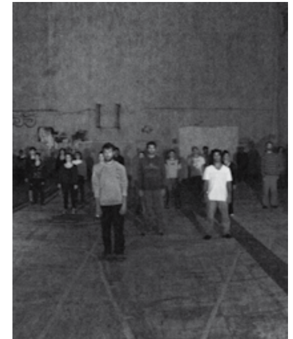
//////////////////// GRUPO DE DANZA MULTITUD Viernes 8 | 21:00 | Callejón de la Universidad - 18 de Julio y Tristán Narveja

Hoy sigue en pie el compromiso con las causas populares, intentando aportar un “grano de arena” a la construcción de la memoria desde la poesía y el canto.