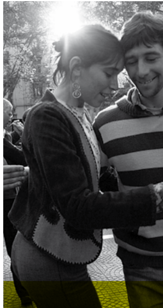
//////////////////// TALLER DE TANGO A CARGO DE AVALANCHA TANGUERA Miércoles 6 | 22:30 | Carpa Maestra Elena Quinteros.

Nuestro tango se nutre de diversas propuestas estéticas y estilos de baile. Prima en él una propuesta ética de compartir la experiencia de bailar con personas de las más diversas procedencias. En nuestros doce años de historia hemos sembrado grupos por más de treinta locales en Montevideo, diez ciudades del Interior y hemos realizado Avalanchas (Intervenciones Urbanas de Tango) en más de trescientas plazas y esquinas de todo el país. Así el tango se convierte en pretexto para el encuentro y el encuentro en pretexto para aprender a bailar.