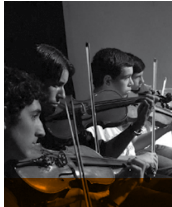
//////////////////// GRUPO SONANTES Jueves 7 | 21:00 | Paraninfo de la Universidad -18 de Julio 1824, esquina Eduardo Acevedo-.

Nuestro tango se nutre de diversas propuestas estéticas y estilos de baile. Prima en él una propuesta ética de compartir la experiencia de bailar con personas de las más diversas procedencias. En nuestros doce años de historia hemos sembrado grupos por más de treinta locales en Montevideo, diez ciudades del Interior y hemos realizado Avalanchas (Intervenciones Urbanas de Tango) en más de trescientas plazas y esquinas de todo el país. Así el tango se convierte en pretexto para el encuentro y el encuentro en pretexto para aprender a bailar.